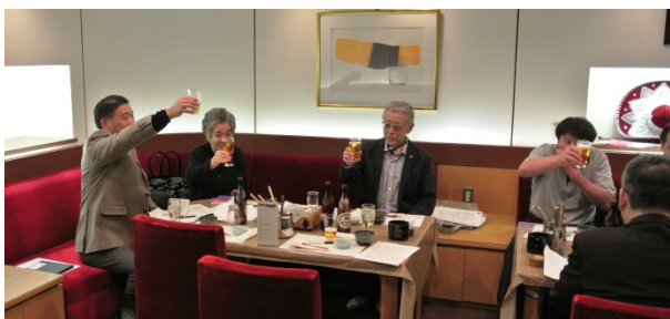
柳井第一副会長による We Serve