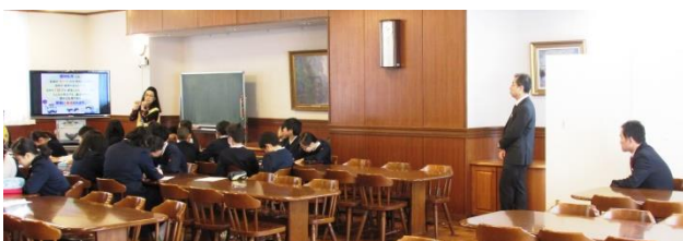
校長先生(左)と副校長先生も聴講