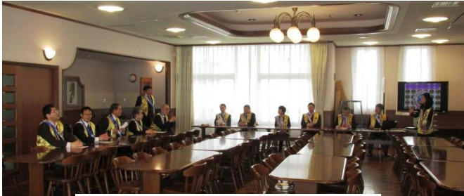
会場にて講義のリハーサル