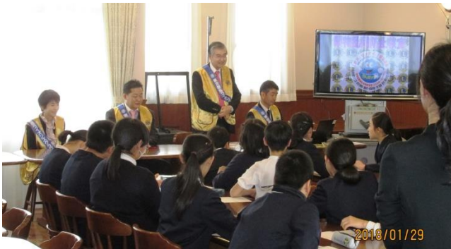
越村会長の教室開催の挨拶