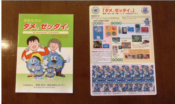
当日生徒さんたちに渡された配布物