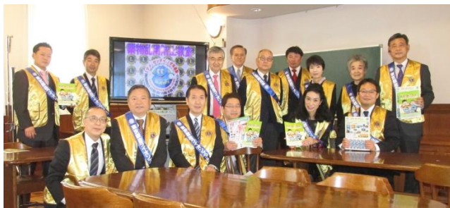
アクティビティ用の金色のベストを着用した参加メンバーの方々