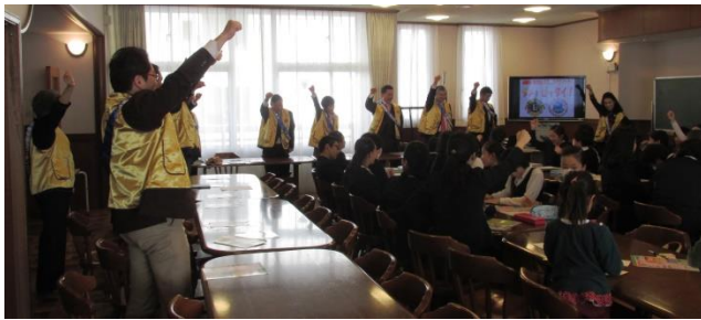
「ダメ、ダメ、絶対ダメ」の連呼