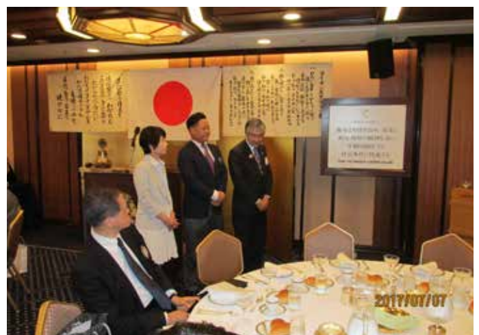
新三役ライオンズの誓い唱和