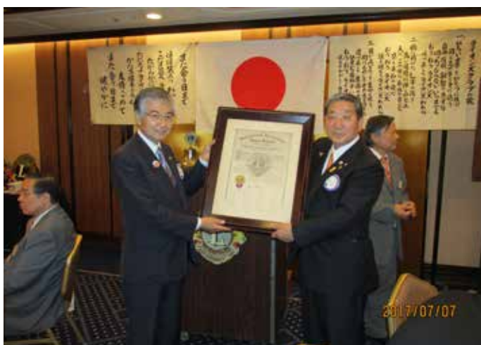
チャーター引き渡し