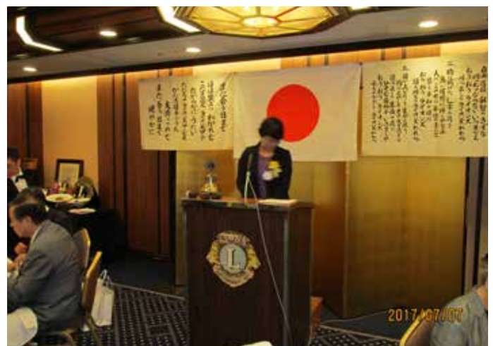
新第3副会長 仲L. 挨拶