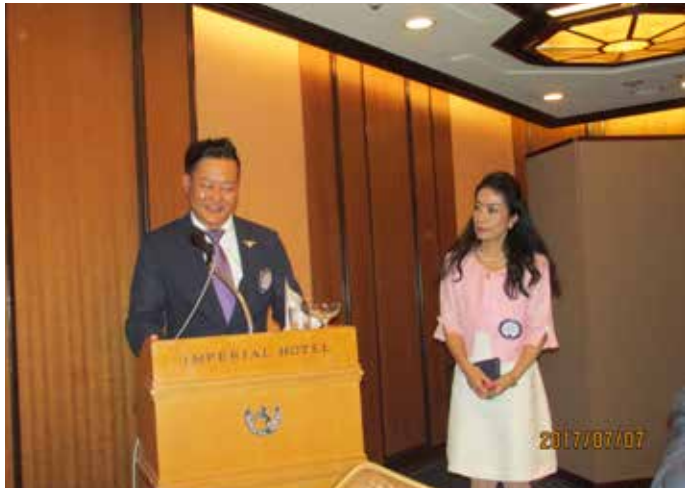
幹事報告とチャリティーコンサート案内(北岡L.)