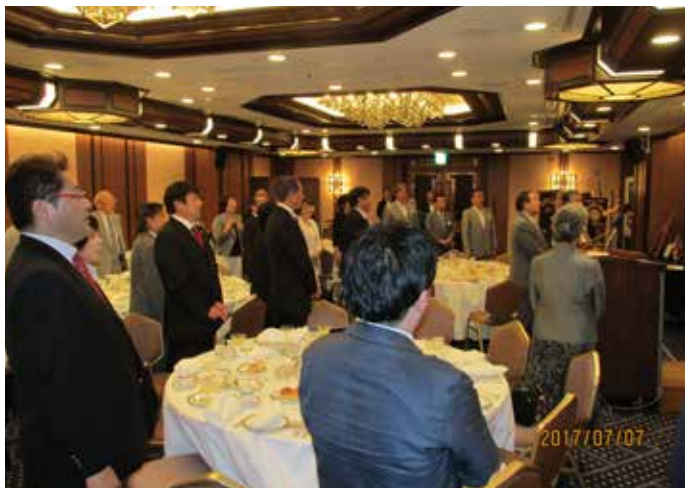
また会う日まで 斉唱