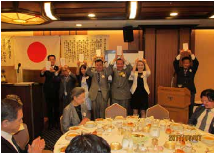
前年度キャビネット役員への記念品贈呈