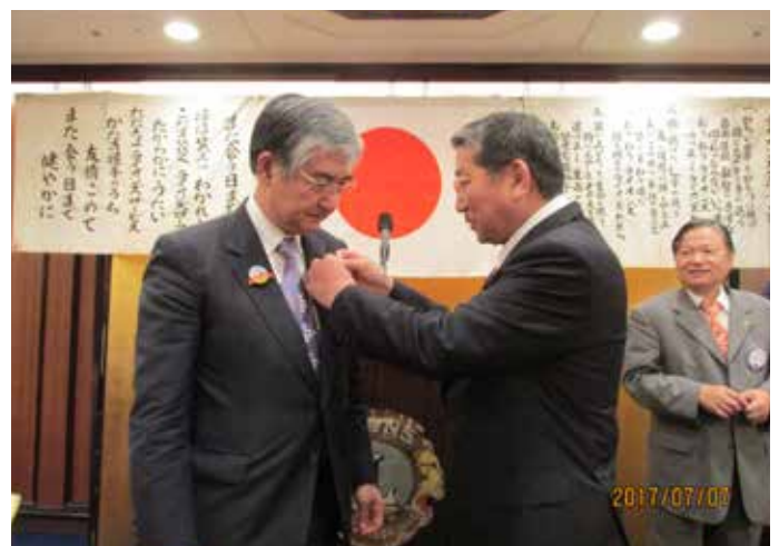
新旧三役ラベルボタン交換