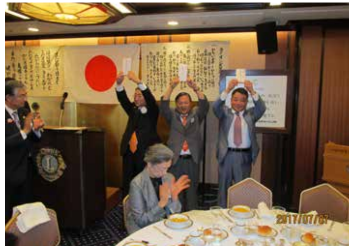
前年度三役へ記念品贈呈