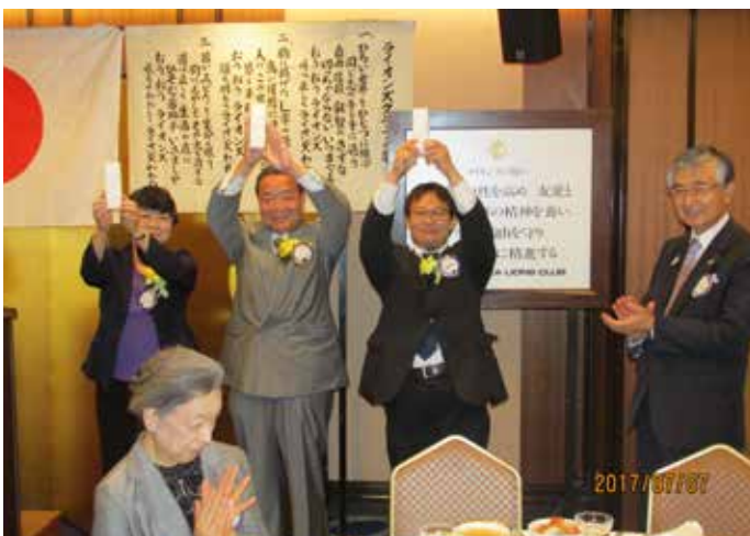
7月誕生日のお祝い