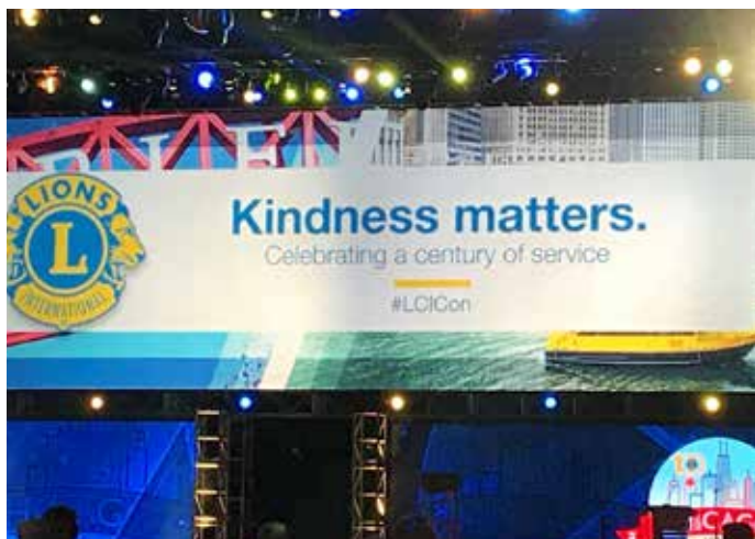
2017シカゴ国際大会会場風景