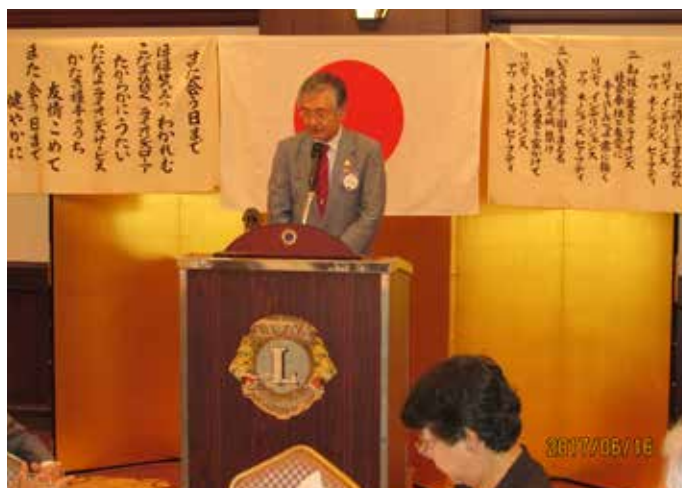
第一副会長退任挨拶 越村L.