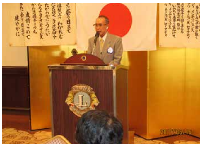
地区いじめ対策青少年委員会委員退任挨拶 鹿島L.