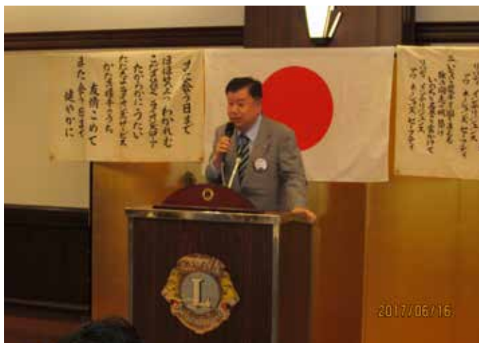
地区選挙管理委員会副委員長退任挨拶 本橋L.