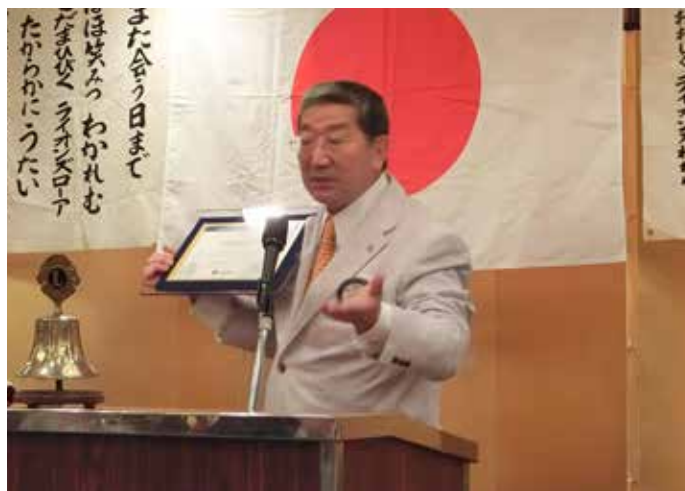
銀座LCへのLCIFよりの感謝状