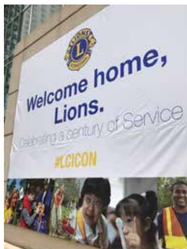
シカゴの街中の掲示看板