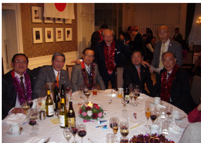
⑰第2部 抽選会の時間にて