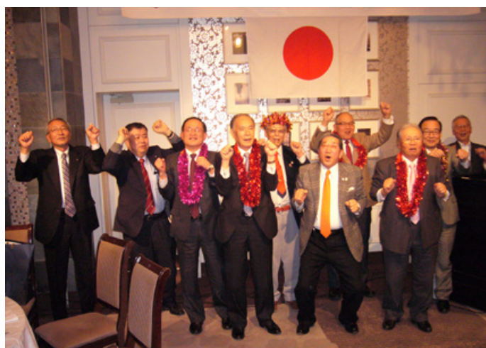
⑱第2部 ライオンズ・ローア 現&元会長