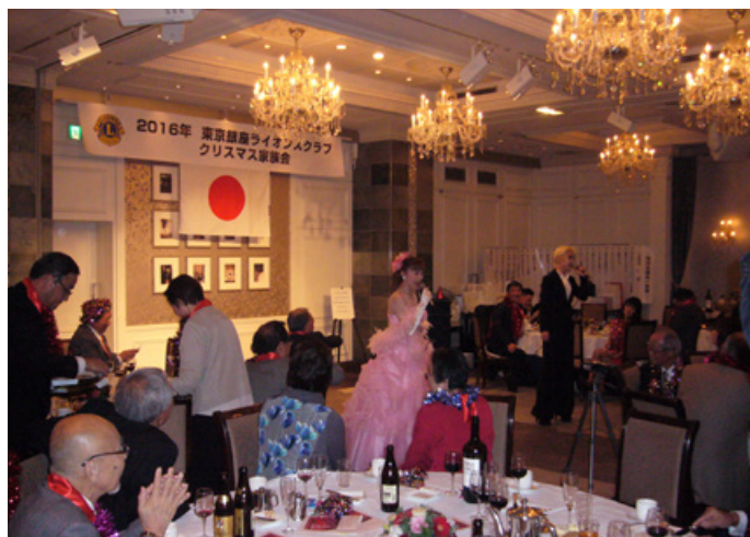
⑭第2部ディナーショー