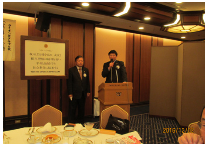
⑩遊子の会開催予告 上田L.