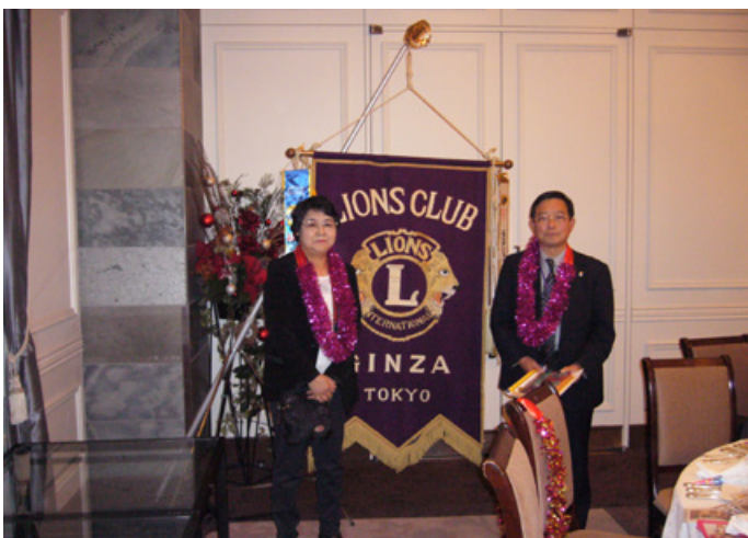
⑤伊東L.とスポンサー仲L.