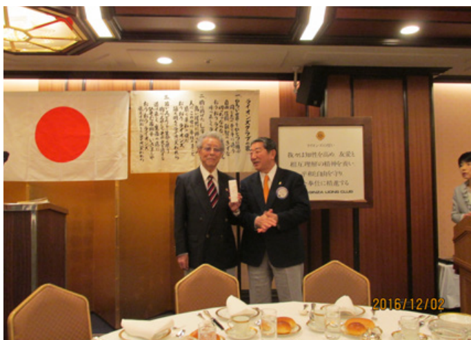
③12月誕生日お祝い 五島L.