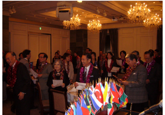
⑧第2部クリスマスパーティ