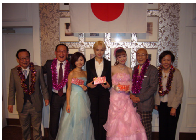
⑯第2部出演者と関係者