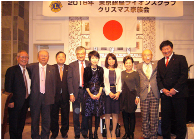
⑩第2部 また会う日まで 斉唱後司会者を中心に