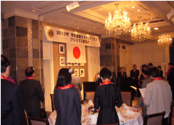
①第1部 例会 君が代斉唱