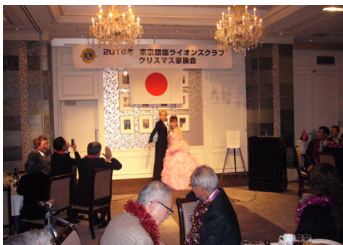
⑮第2部ディナーショー